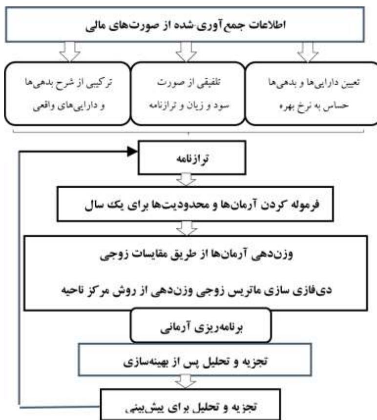
شکل (۱) مراحل انجام پژوهش